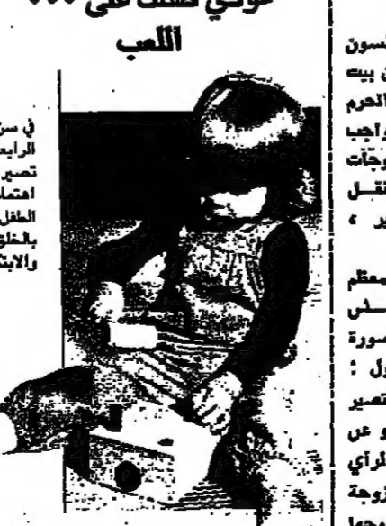
تداخل عند الولد الواقعية بالخيال بشكل يصعب فصل خيوطها. ولهذا السبب، يحلو له خلق عالمه اليميني بشييد الجصور، والحيوت، بفرده بالعالم، انها يخف حوسه بالعلمية الجديدة عما كان عليه سابقا، فهو دائم البحث عن الجديد.

وتكثيرون جدا وخاصة الزوجات ينسون وينسون، بل ويجهلون ويجهلون، ان بيته الزوجية حرم نفس.. وحماية هذا الحرم وسيلته والحفاظ عليه ورعايته واجب سبوري الحمس.. وتكثرون وخاصة الزوجات ينسون حرمة هذا الحرم القس ينقل اخياره القسة والسرية الى الغير، وخاصة الى اهل الزوج. والواقع يقول ان الزوجة هي في معظم الأحيان نقطة البداية لتعظم مسلي زوجها.. وقبل ان تعرض للرجل بصورة خاصة احب ان تعرض للزوجة واقول: ان المرأة التي لا تبني زوجه بعد ان تصير اما تعصر اهتمامها في اولادها، وتكون عن زوجها، وعن مشاركتها في الشعور والرأي والواجب.. هي تودون اننى شك زوجه غير فعليه تيميلها هذا عقل نجاح زوجها في زواجه. اما المرأة التي تبني ابنة اولادها بعد ان تصير زوجه اي ان اكارها ومشارعتها تبقى منحصرة في اهلها لا تفكر الا فيهم ولا تنهم الا بالموهم ولا تصل الا ابراهيم.. تكل زوج مها كان وديماطيا مسالا ياملل حين يرى ان رأي غيره سائد في بيته، وان زوجته تهم باطلها اكثر واكثر من اعتبارها به ويراهته. ثم هناك الزوجة التي تريد ان تبني حيث هي.. فإفارة تفكر دائما في جيب زوجها الى جانب اهلها وتكثن بهذا تكسب وجه وعقله. اما الزوجة التي تتارن زوجها بغيره من الرجال فإفارة تهمرا عنهم، فبدلا من ان تبذل في معانوته ودمعه ودمعة الى الامام تتخذ بجزء الى الوراء. ثم هناك الزوجة التي تتارن من زوجها